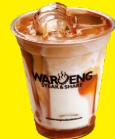
CARAMEL LATTE | CARAMEL MACHIATO | KOPI SUSU GULA AREN CAFE LATTE | ESPRESSO | AMERICANO | CAPPUCINO