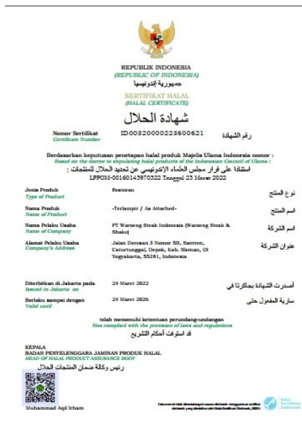
Sertifikat Halal BPJPH Kemenag RI