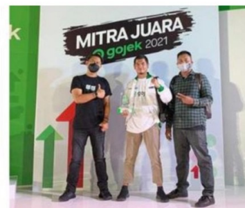
Mitra Juara Gojek 2021