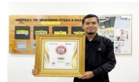
Top Digital Public Relation 2022