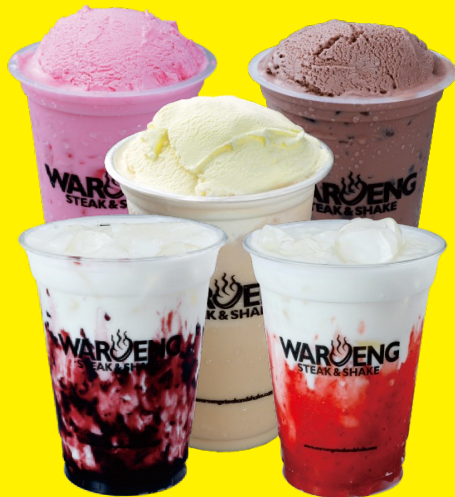
STRAWBERRY | VANILLA | COKLAT | MOCCA MILKY BLUEBERRY | MILKY STRAWBERRY