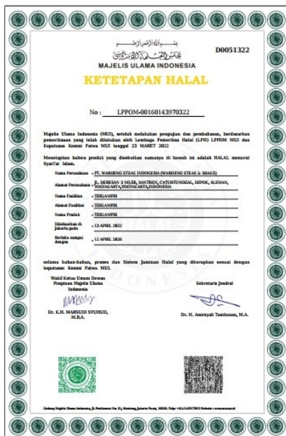
Ketapan Halal MUI Pusat